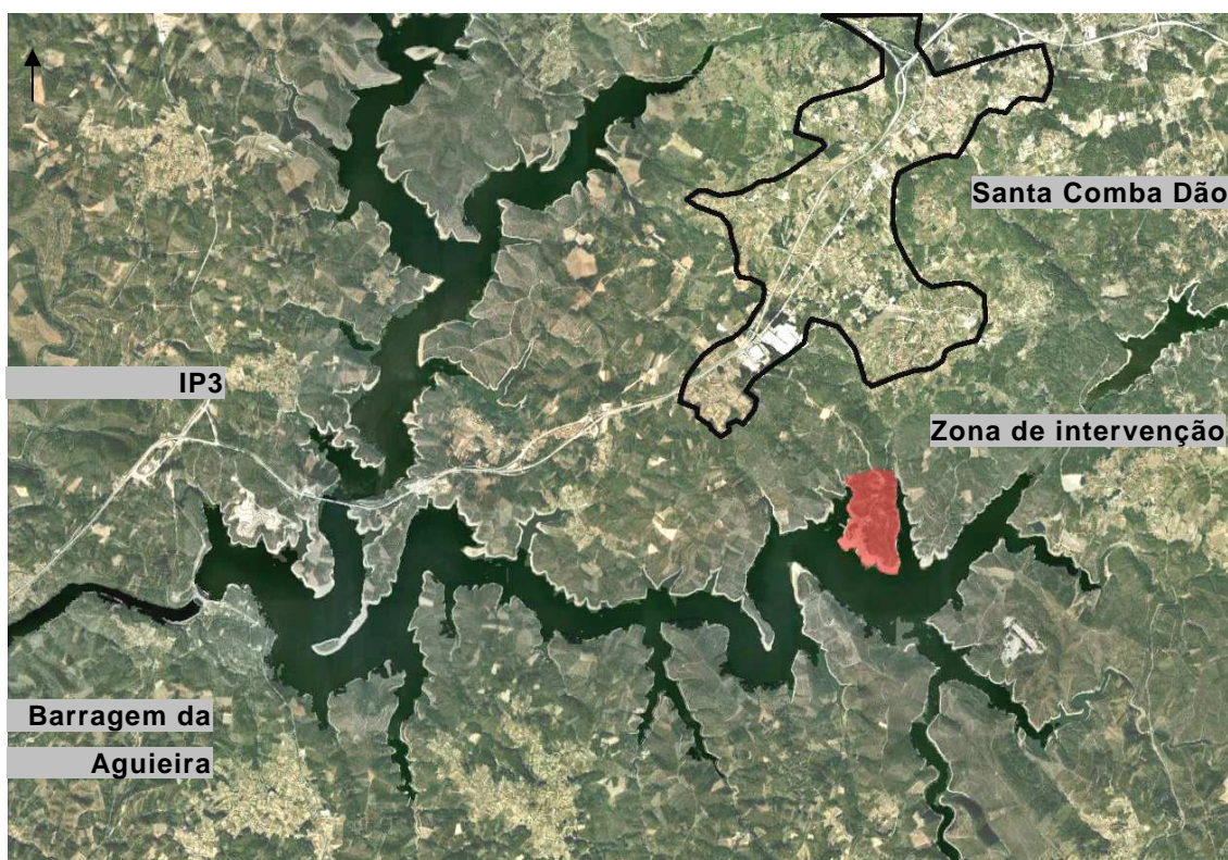
Figura 1 – Enquadramento da área de intervenção

A albufeira da Aguieira é uma área limite entre os concelhos de Penacova, Carregal do Sal, Mortágua, Santa Comba Dão, Tábua e Tondela, constituindo um importante reservatório de água para abastecimento e produção de energia eléctrica dos municípios vizinhos. Aqui desenvolvem-se também várias actividades de recreio e lazer associadas ao plano de água.